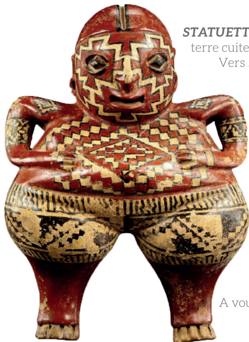
STATUETTE CHUPICUARO terre cuite peinte de 31 cm. Vers 500 av. J.-C.

La culture Chupicuaro est un peu comme celle des Mayas ou des Aztèques. Elle existait avant la découverte de l'Amérique par Christophe Colomb (vers 1500). C'est pour cela que l'on parle d'art précolombien (les arts qui existaient avant l'arrivée de Colomb et des conquistadors espagnols et portugais). Il y avait alors de brillantes civilisations qui avaient de nombreux dieux. Cette statuette en était sûrement une représentation.