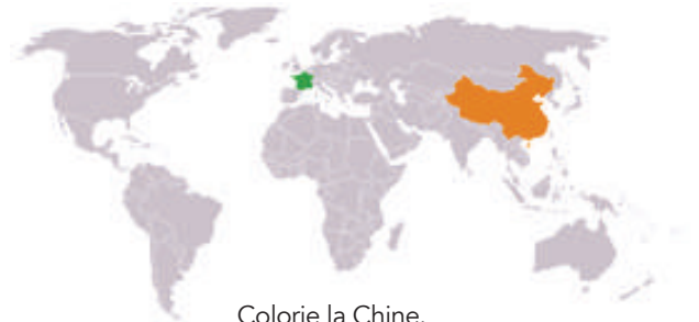
Colorie la Chine.

Les toits sont décorés de statuette. Leur nombre indique l'importance du lieu. 3 ou 5 statuettes : bâtiment mineur. 10 statuettes : important !