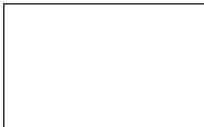
Reproduis le drapeau de la Chine.