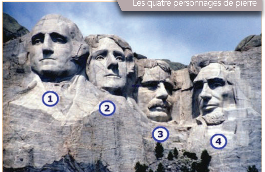
Les quatre personnages de pierre