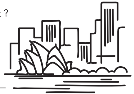
Colorie ici l'opéra de Sydney :

- Combien de temps a-t-il fallu pour le construire ?