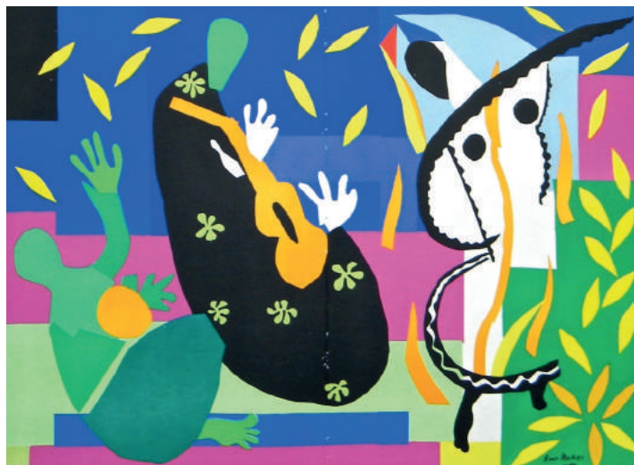
LA TRISTESSE DU ROI d'Henri Matisse (1952)

Mais au fait, qu'y a-t-il sur ce tableau ?.. un musicien à gauche (avec son tam-tam), une danseuse à droite (qui semble tourbillonner). Et au milieu ? Une figure noire avec une guitare et quelques fleurs : le roi. Le titre dit qu'il est triste ("La tristesse du roi") au milieu de cet air de fête. Sans doute Matisse s'est-il représenté à travers ce roi que plus rien n'amuse. C'est donc un tableau très coloré et très mélancolique à la fois. Le roi c'est Matisse lui-même.